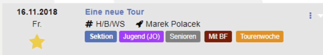
Abbildung 1 - Farbcodierung für Tourengruppen frei definierbar.