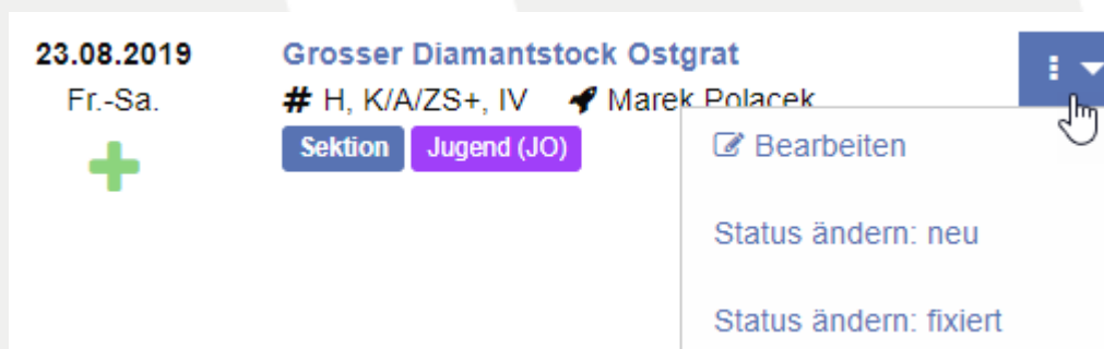
Abbildung 2 - Alle mögliche Aktionen einfacher erreichbar.