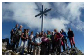
Die ganze Gruppe auf dem ZZ-Gipfel

Ueli ist mit der Veröffentlichung einverstanden