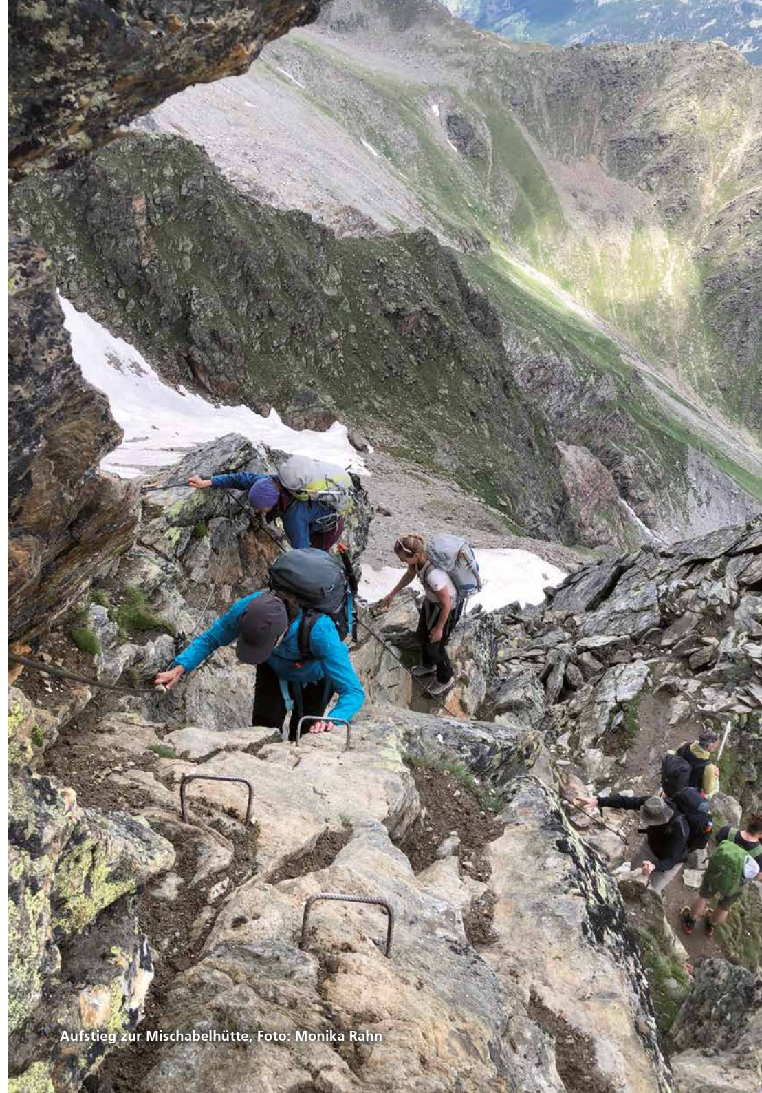
Aufstieg zur Mischabelhütte