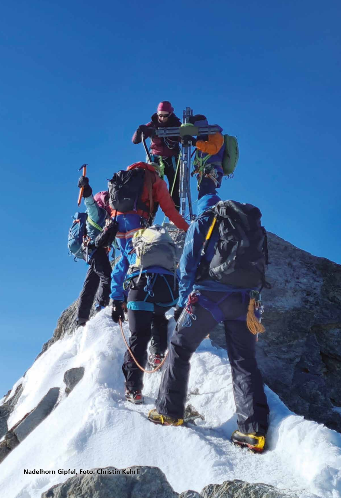
Nadelhorn Gipfel, Foto: Christin Kehrl