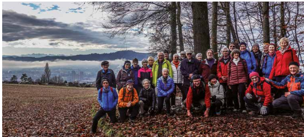
↑ SeniorInnen des SAC Albis auf dem Höngerberg, vor dem Treffen im Restaurant Grünwald

Das Seniorentreffen vor Weihnachten fand diesmal nicht wie seit Jahren im Hotel Sonnental in Dübendorf statt, sondern in der «Schüür» des Restaurants Grünwald in Zürich Höngg. Rund 50 Seniorinnen und Senioren nahmen an dem Anlass teil.