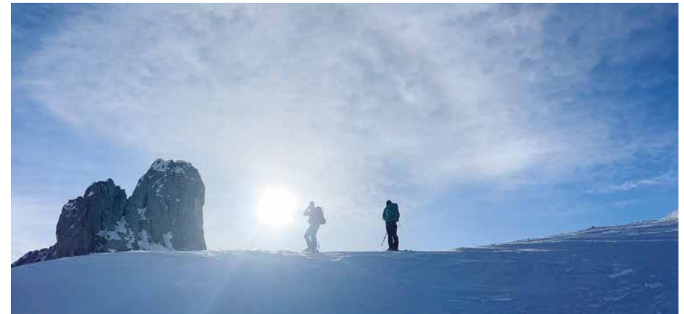
↑ Beim Hasaflüeli