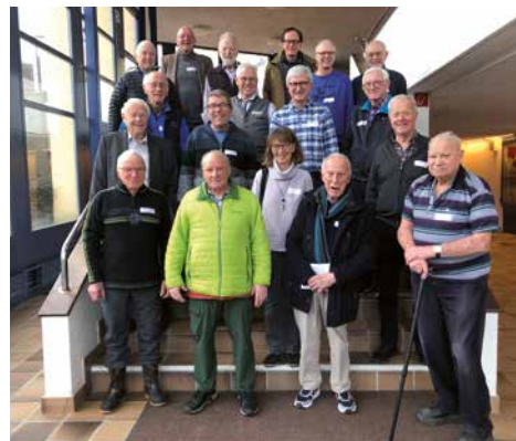
↑ Die Jubilarin und Jubilare vor dem Brüelmattgebäude

Eine Jubilarin und 15 Jubilare mit 40 und mehr Mitgliedsjahren folgten der Einladung zum Seniorentreffen am 9. Januar in der Brüelmatt. Gegen 30 Seniorinnen und Senioren nahmen an dem Anlass teil.