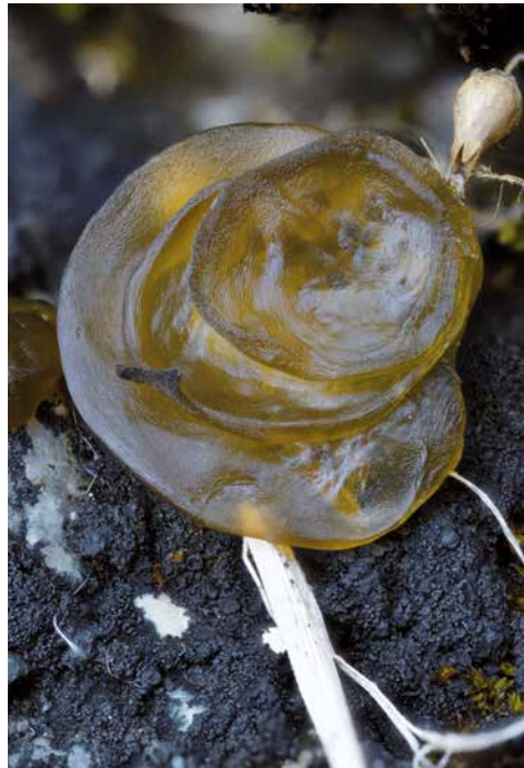
↑ Eine Kolonie von Sternschnodder (Nostoc commune) wächst an einer Stützmauer an der Vannazhalde. Die Bildbreite entspricht 24 mm.