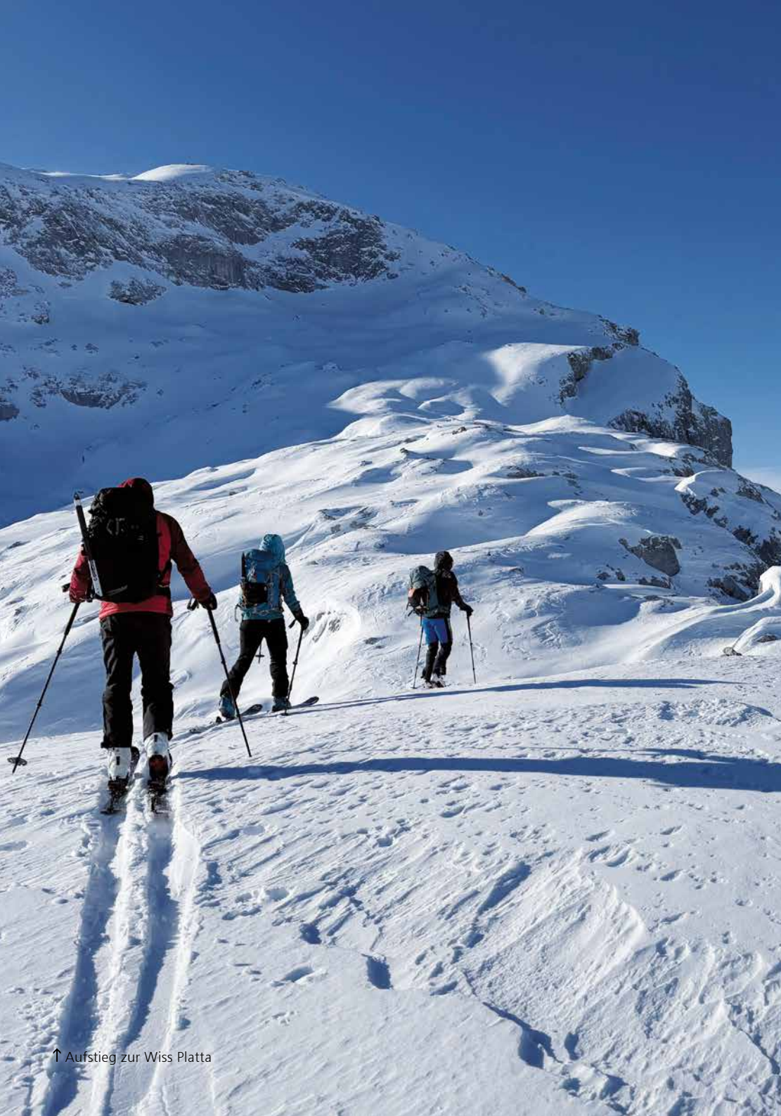
↑ Aufstieg zur Wiss Platta