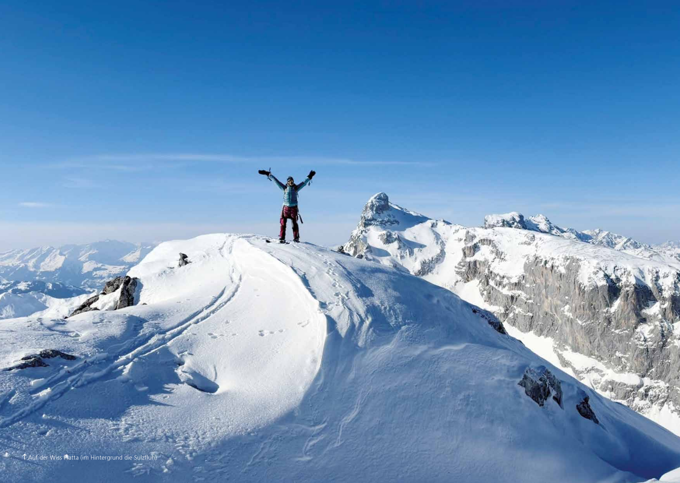
↑ Auf der Wiss Platta (im Hintergrund die Sulzfluh)